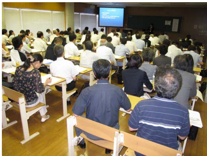
写真1 セッションの様相